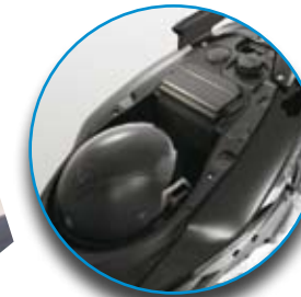
L'ampio vano sottosella può contenere un casco integrale