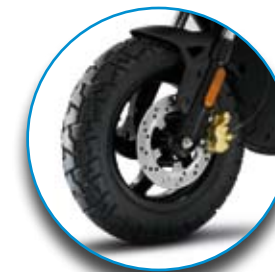
Pneumatici da 12" di ampia sezione