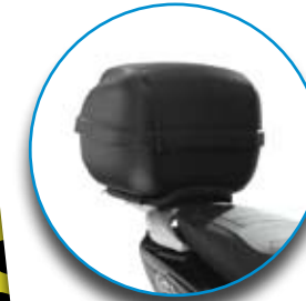
Kit bauletto nero gofrato